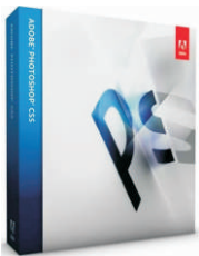
Adobe Photoshop Cs5