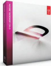
Adobe InDesign CS 5.5