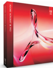
Adobe Acrobat X Pro

Adobe Photoshop je ideálním nástrojem pro maximální využití digitálních obrazů. Umožňuje jejich transformaci na cokoli, co si dokážete představit, a jejich zobrazení výjimečným způsobem.