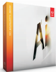
Adobe Illustrator Cs5